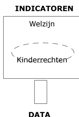
Figuur 1. De verhouding tussen kinderrechtenindicatoren en kinderen- en jongerenwelzijnsindicatoren

minimumstandaarden gerespecteerd of geschonden worden. Echter, vanuit de in het VRK uitgedragen idealen tot het promoten van sociale vooruitgang, persoonlijke ontplooiing en individueel welzijn (VRK, preambule), kaderen deze minimumstandaarden onvermijdelijk in een breder welzijnsperspectief (cf. Govaert, 2009: 3). Dit impliceert dat, hoe sterker men de kinderrechtenindicatoren vanuit een meer 'maximalistische' visie gaat benaderen (i.e. het concept kinderrechten ruimer gaat interpreteren), des te vager de grenzen worden met bredere welzijnsindicatoren (zie figuur 1).